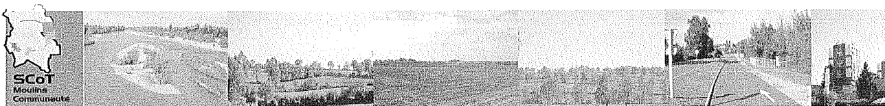
Schéma de Cohérence Territoriale Moulins Communauté

Arrêté préfectoral en date du 20 septembre 2002, délimitant le périmètre du Schéma de Cohérence Territoriale de l'Agglomération de Moulins