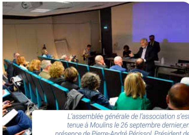
L'assemblée générale de l'association s'est tenue à Moulins le 26 septembre dernier, en présence de Pierre-André Périssol, Président de Moulins Communauté.