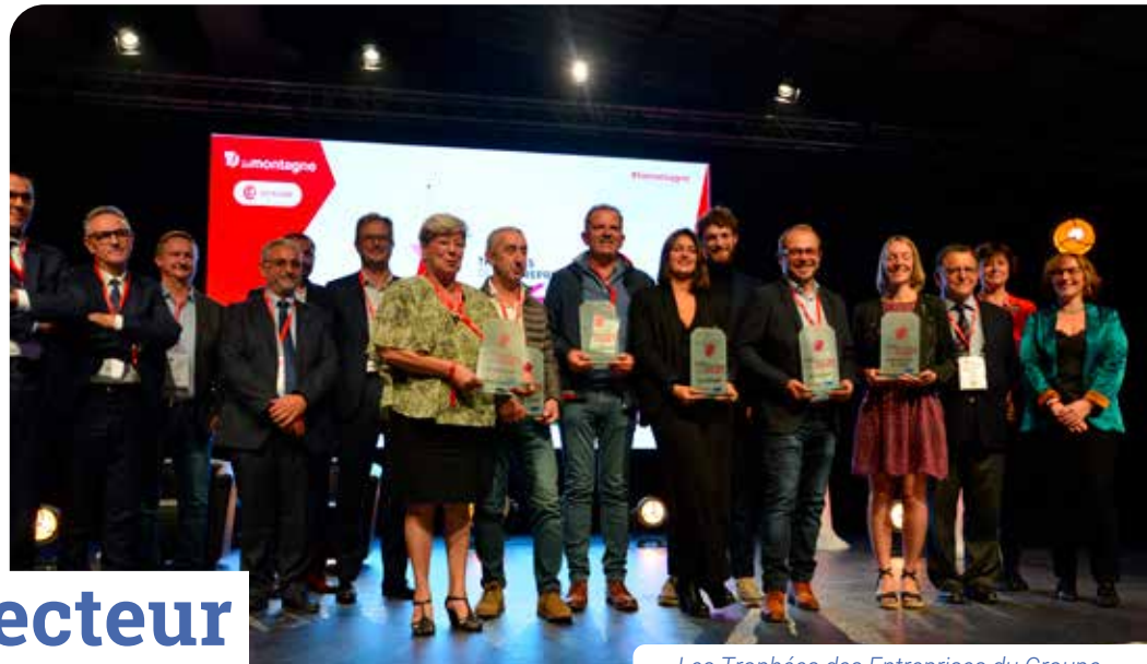
Les Trophées des Entreprises du Groupe Centre France La Montagne avaient été remis à Moulins en 2021.

Pour sa 6 e édition, le Trophée des Entreprises du groupe Centre France La Montagne se tiendra à Moulins le 7 novembre. Moulins Communauté fait partie des partenaires de cette manifestation qui met en valeur le dynamisme économique des territoires.