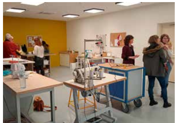
Atelier au rez-de-chaussée