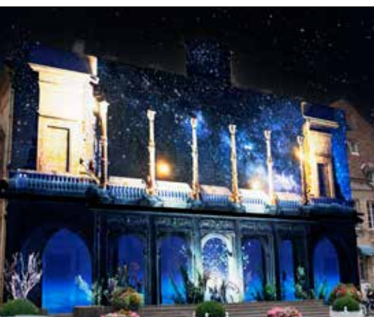
Moulins entre en Scène