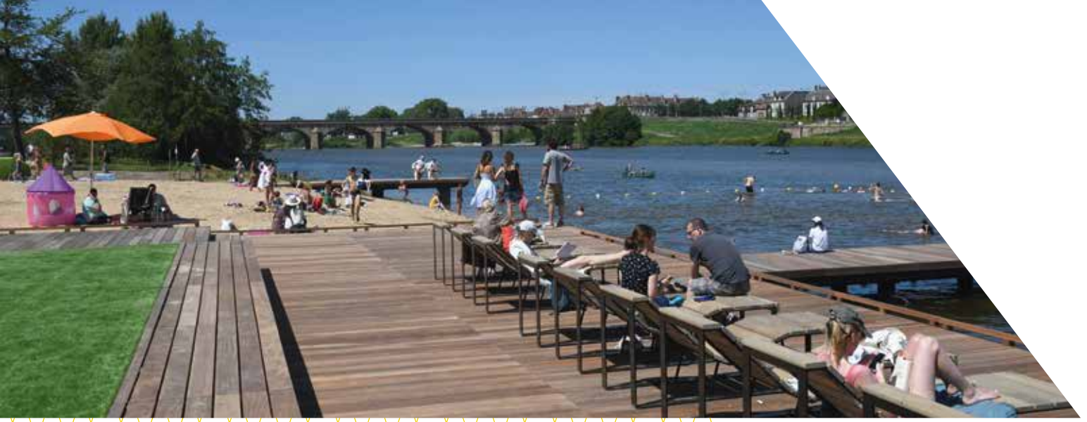
Berges de la rivière Allier