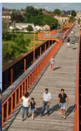
Pont de fer