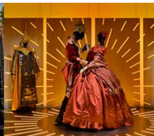
Centre national du costume et de la scène